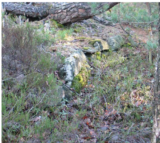
En del av alteret fra 1876