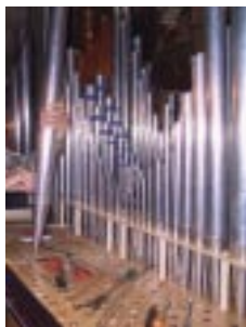
Fra omintoneringen av orgelet

Det er forventet at dette orgelet som har tilnærmet lik stemmeprakt som det opprinnelige Gloger-orgel skal være i bruk i flere generasjoner fremover.