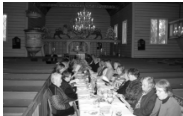
Påskemåltid på Sønedeled (Arkivbilde)