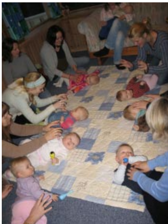
Arkivbilde fra tidligere babybsang

Vi ønsker mange flere velkommen til å være med, også pappaer. Etter samlingsstunden spiser vi sammen med de som er i åpen barnehage. Den er åpen hver mandag, onsdag og fredag fra 10.00 til 13.00. Hjertelig velkommen både til babysang og åpen barnehage.