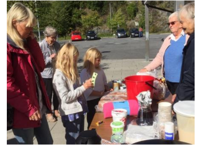
Loddsalget går unna

Ilulagruppen støtter også en av IOPs førskoler, Kid's Corner Preschool med ca. 70 barn får et fruktmåltid i uka.