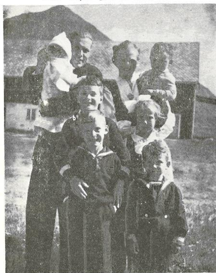
Bilde fra Søndeled Menighetsblad Juli 1958. Presteparet med barna.