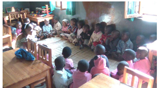
De minste barna i Kid's Corner følger godt med.