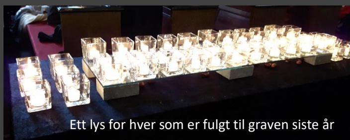
Ett lys for hver som er fulgt til graven siste år