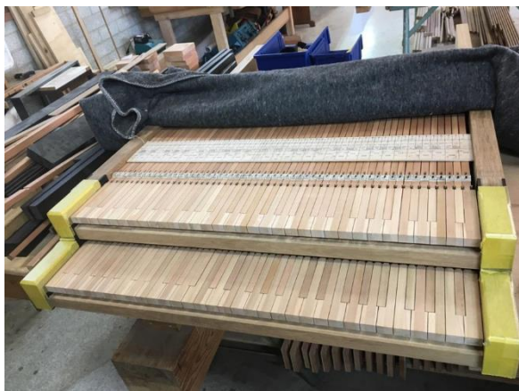
Spillebordet med to manualer begynner å ta form. Tangentene er laga av balsatre og skal belegges med lyst bein og ibenholt som overflatemateriale.

Det er selvfølgelig også litt moro å ha vært de aller første fra Sønedeled til å se det nye orgelet, riktignok i masse deler og biter, men likevel! Det er bare å begynne å glede seg til det blir ferdig og kommer på plass i Sønedeled kirke til våren. Vi kommer til å få et praktfullt instrument som blir vel verdt både å høre og se, det blir skikkelig gildt!