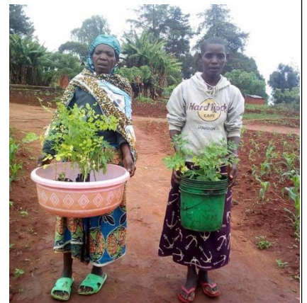
Fosterforeldre, klar til å plante Moringa oleifera i landsbyen Isagwa, Ilula

IOP er en ikke-statlig organisasjon som arbeider for å støtte de mest utsatte barna i Tanzania. Landet har i lang tid hatt en stabil økonomisk vekst. Dette har imidlertid ikke kommet den fattige delen av befolkningen til gode. 45% av barn under fem år er feilernærte. Fosterfamilieprosjektet i organisasjonen støtter familier som tar seg av to eller flere foreldreløse barn. Besteforeldre tar seg av foreldreløse barnebarn. Gamle mennesker, uten pensjon eller annen inntekt, kan gjøre en forskjell når ressursene er tilgjengelige. De kan plante trær og stelle dem. Bestemødre er glade for at de kan være med i samfunnsutviklingen. De er stolte fordi de bidrar til et bedre klima og bedre ernæring for barnebarna. Og de kan være rollemodeller for andre.