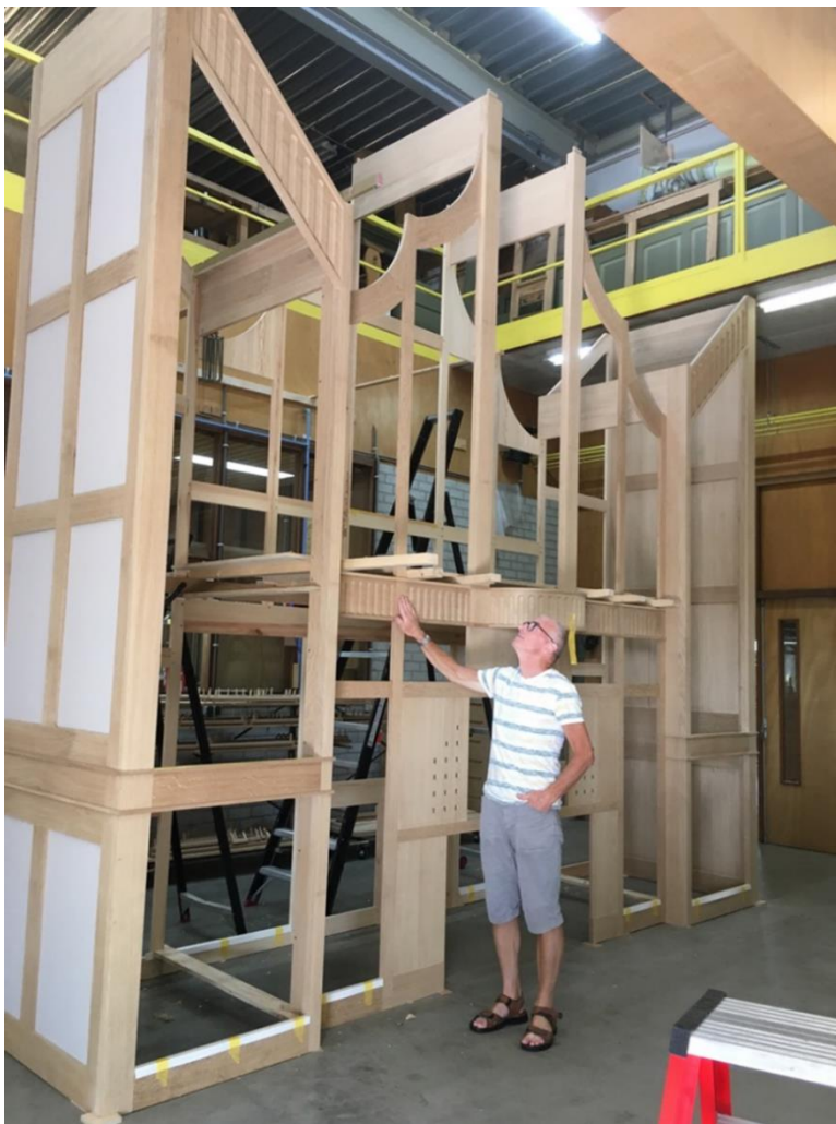
Orgelluset bygges i limt eik, det blir skikkelig svært - og flott!