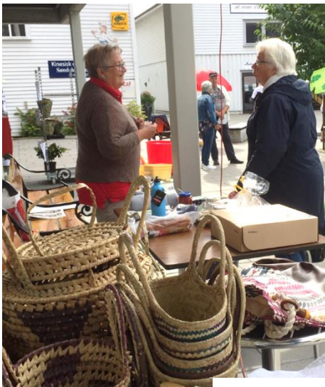
Lynlotteri. Salg av sveler og kurver

Ilula ligger i Iringa regionen i Tanzania, ca. 1600 meter over havet. Det er et vakkert landskap med fjell, skogkledde åser og store jordbruksområder. Hovedveien til det sørlige Afrika går gjennom Iringa. IOP-senteret ligger en kilometer fra hovedveien.